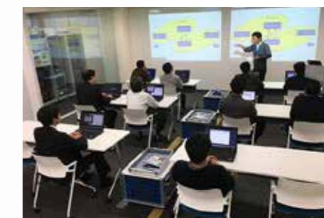
ハンズオントレーニング