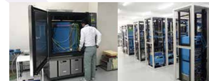
つくばネットワーク技術センター

開発した製品の品質・信頼性が情報インフラを支えるレベルに達しているかを厳しい基準で検査・判断しています。