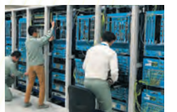
つくばネットワーク技術センター内施設

ユーザー様にとっての「丁度いい」機能を搭載することと、安心して使い続けられる品質を両立させた製品開発。お使いになるネットワーク環境を踏まえた実証実験もサポートいたします。